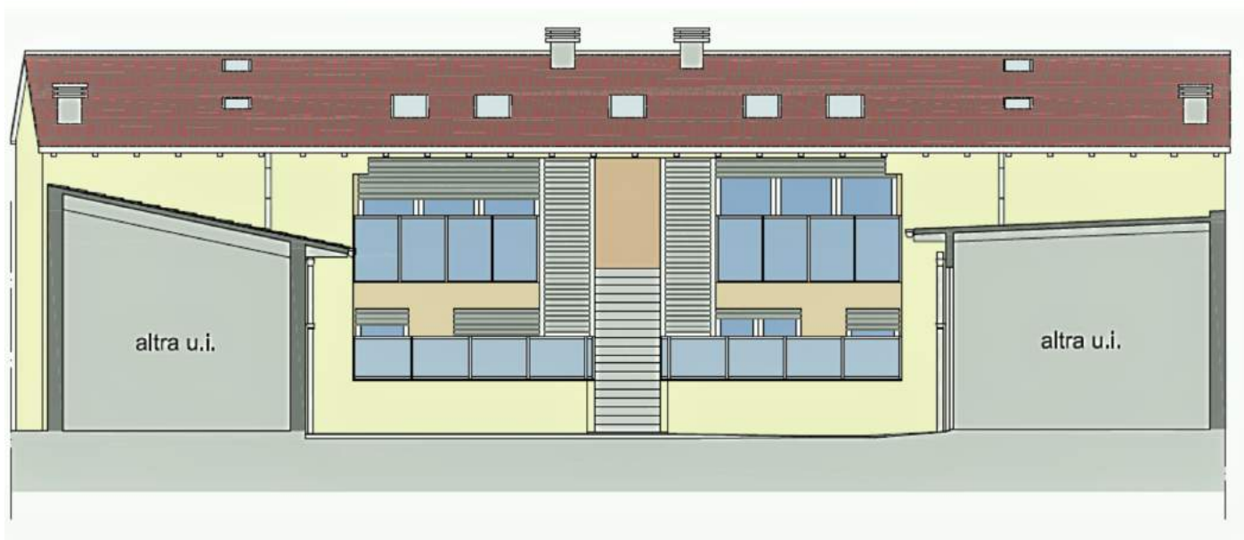
Appartamenti primo piano